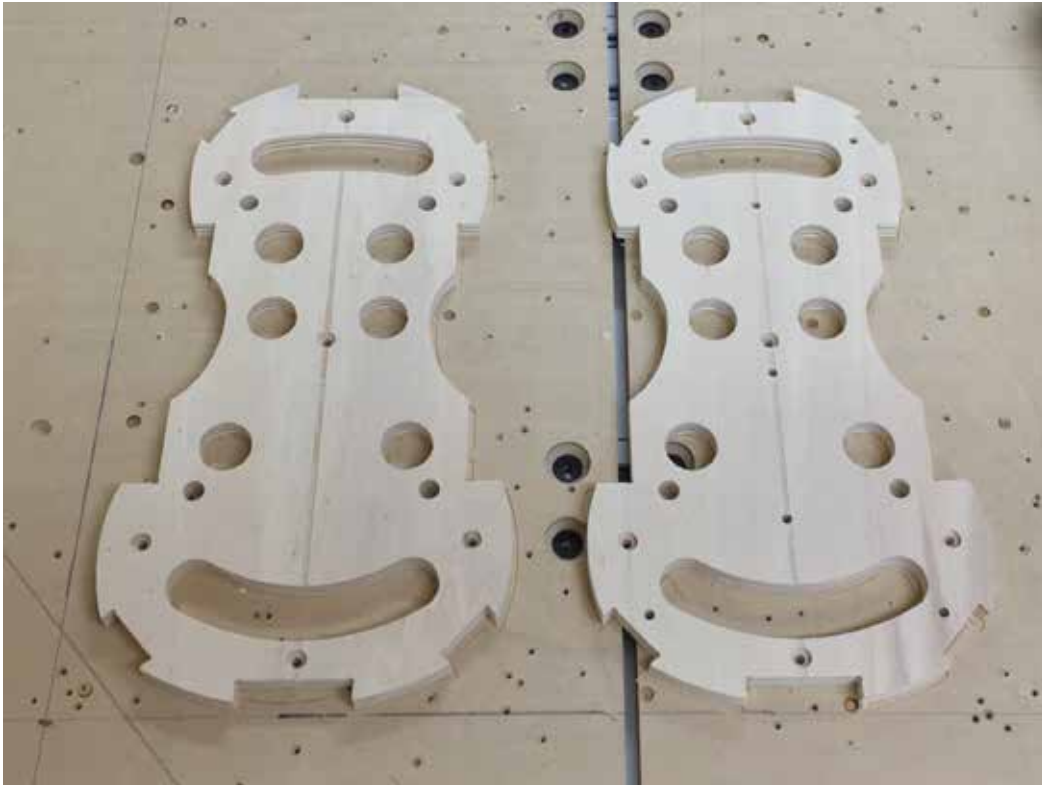
Moules pour violon usinés à la CNC Luthier : Thierry Sterckeman Crédit photo : Carl-Dave Lagotte, 2020.